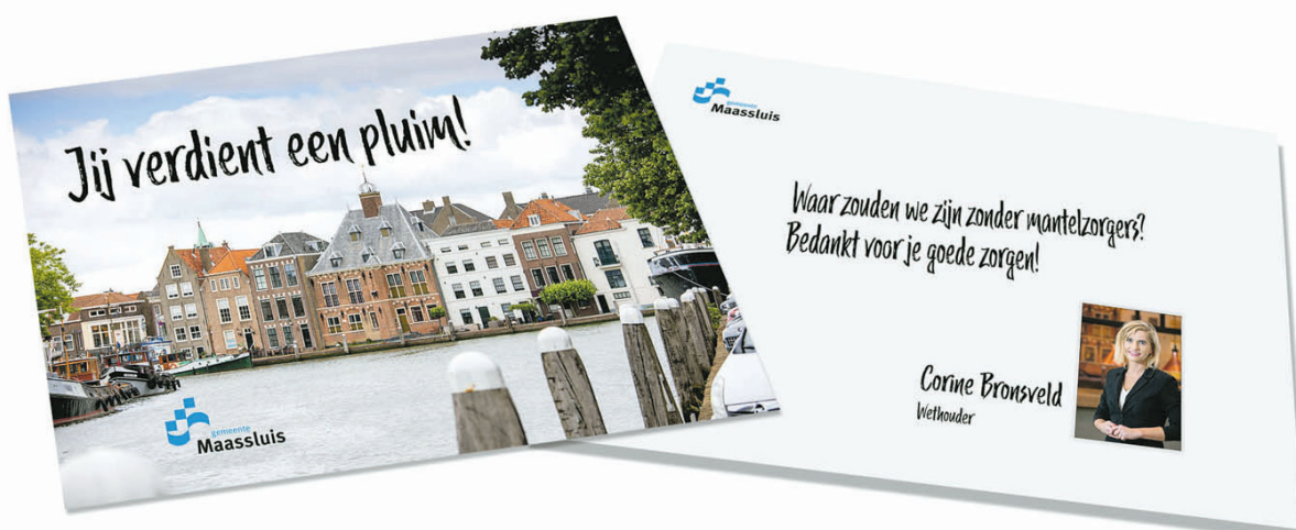
Het bedankkaartje van de wethouder.