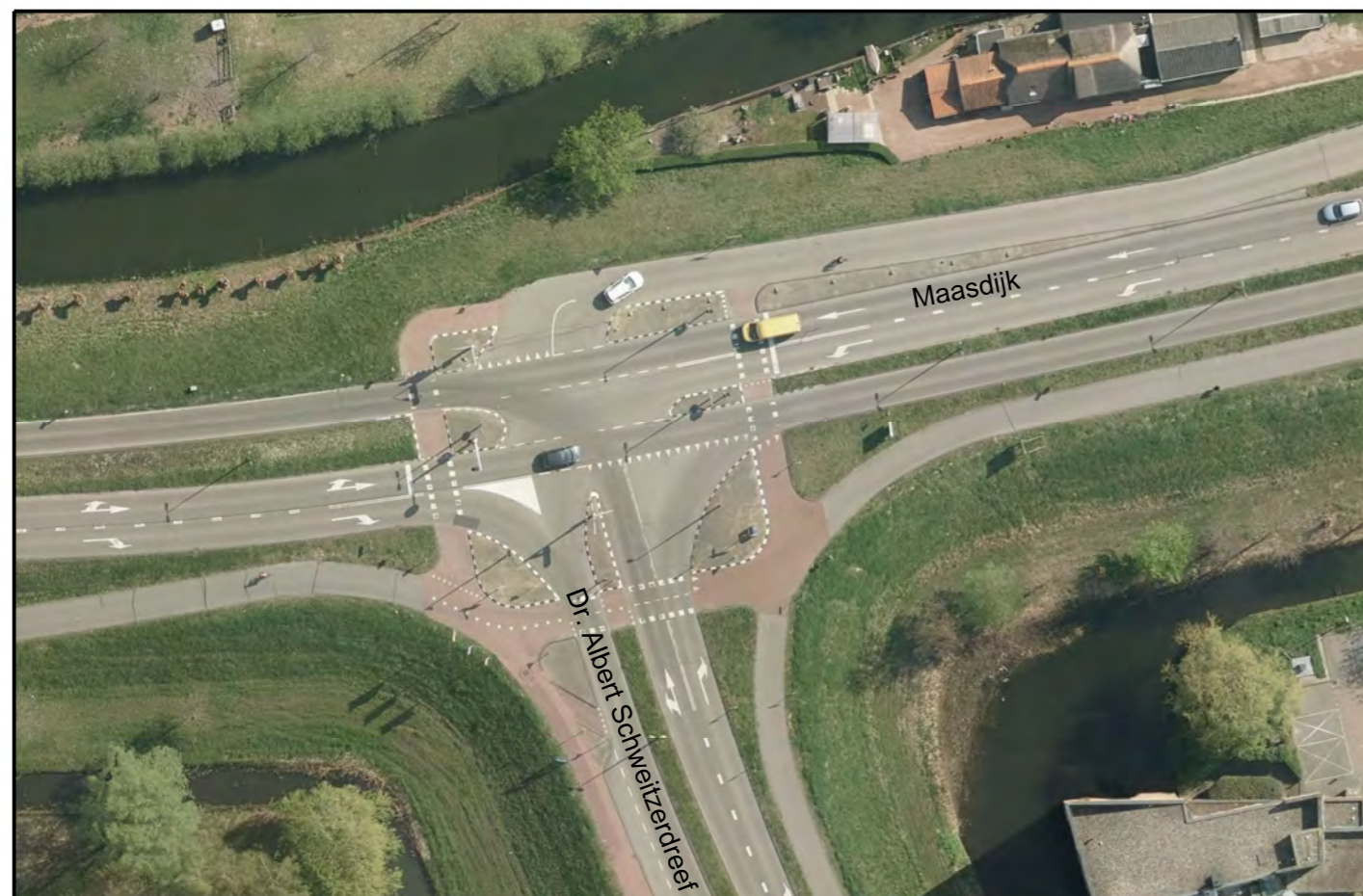
Luchtfoto bestaande situatie kruising Maasdijk - Dr. Albert Schweitzerdreef